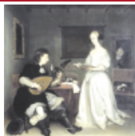
Les Musiciens du Palais Royal

CONTACT Les Musiciens du Palais Royal 1, rue du cimetière 77600 Bussy-St-Georges France Téléphone : (33) 1 64 66 25 13 ou (33) 6 89 21 97 27 musiciensdupalais@wanadoo.fr http://perso.wanadoo.fr/lesmusiciensdupalaisroyal/